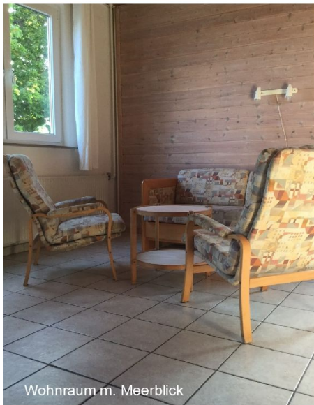
Wohnraum m. Meerblick

Geräumige Wohnung mit Blick aufs Meer, ebenerdig, mit Seeterrasse. Geeignet für zwei, vier oder max. 5 Personen: Wohn-/Esszimmer mit integrierter Küchenzeile (Geschirrspüler), Sitzgruppe (Sofa als 5. Schlafplatz nutzbar), Esstisch für 4-5 Personen, Parabol-TV mit deutschen Programmen. Küchenzeile mit 4-Platten-Elektroherd, Kühlschrank, Komplettgeschirr, Kaffeemaschine, Teewasserbereiter, Toaster etc., zwei separate Schlafzimmerchen mit je zwei Einzelbetten, modernes Duschbad, (WC wandhängend), Duschecke. Eigener Eingang. Aussenterrasse zum Meer. Die Wohnung ist ölzentralbeheizt, zusätzlich mit BIO-Ethanolkamin für gemütliche Abendstunden, große allgemein genutzte Liegewiese am Meer.