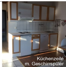
Küchenzeile m. Geschirrspüler