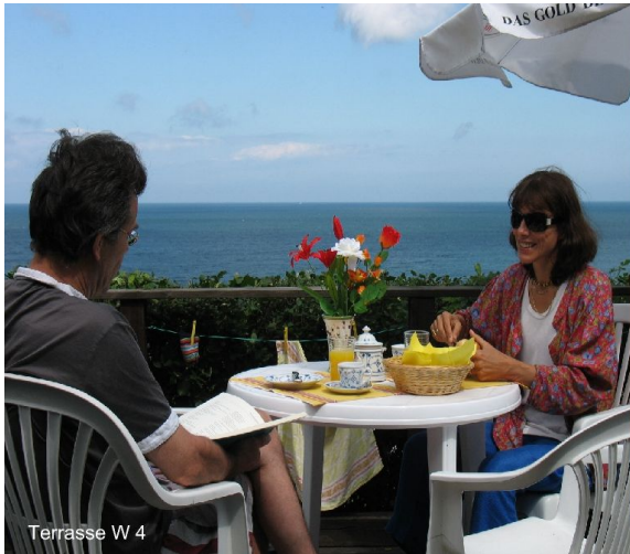
Terrasse W 4