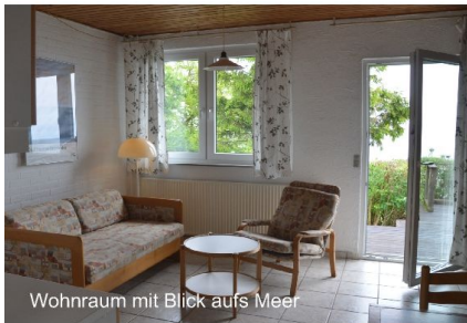
Wohnraum mit Blick aufs Meer

Geräumige Wohnung mit Blick aufs Meer, ebenerdig, mit Seeterrasse. Geeignet für zwei oder max. 3 Personen: Wohn-/Esszimmer mit integrierter Küchenzeile, Sitzgruppe (Sofa als 3. Schlafplatz nutzbar), Esstisch für vier Personen, Parabol-TV mit deutschen Programmen. Küchenzeile mit 4-Platten-Elektroherd, Kühlschrank, Komplettgeschirr, Kaffeemaschine, Teewasserbereiter, Toaster etc., ein separates Schlafzimmer mit zwei Einzelbetten, modernes Duschbad. Eigener Eingang. Aussen-terrasse zum Meer. Die Wohnung ist ölzentralbeheizt, für gemütliche Abendstunden: BIO-Ethanolkamin, große allgemein genutzte Liegewiese am Meer. Parkplatz vor der Wohnung (Landseite).