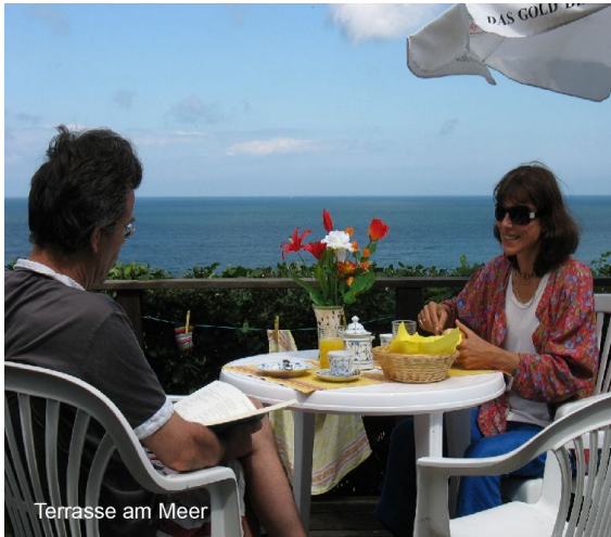
Terrasse am Meer