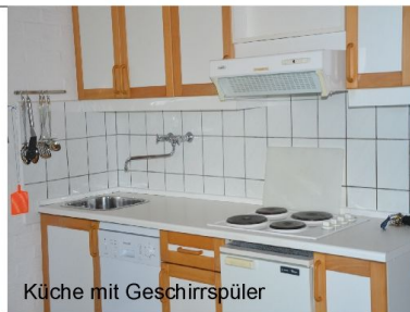
Küche mit Geschirrspüler