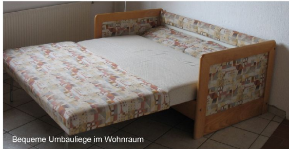
Bequeme Umbauliege im Wohnraum