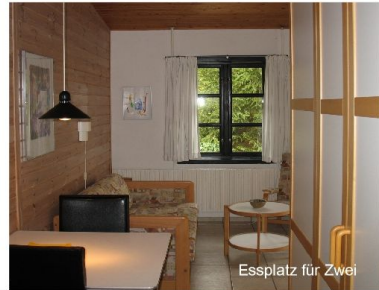
Essplatz für Zwei