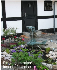
Eingangsbereich/ Innenhof Landseite

Zweckmäßig eingerichtetes Appartment mit Blick ins Grüne ebenerdig, mit nach Westen gerichteter Terrasse. Geeignet für ein bis zwei Personen: Kombinerter Wohn/Schlaf/Essraum mit integrierter Küchenzeile,, Sitz/Liegesofa 140 cm breit ( wird zum Schlafen mit wenigen Handgriffen zum bequemen Bett umgebaut, Esstisch für zwei Personen, Parabol-TV mit deutschen Programmen. Küchenzeile mit 2 - Platten-Eltherd, Kühlschrank,, Komplettgeschirr, Kaffeemaschine, Teewasserbereiter, Toaster etc; modernes Duschbad / WC, eigener Eingang. Aussenterrasse mit Blick ins Grüne und durchs Geäst der Bäume auch teilweise zum Meer. Die Wohnung ist ölzentralbeheizt, große allgemein genutzte Liegewiese am Meer. Parkplatz am Appartment ( Landseite ) .