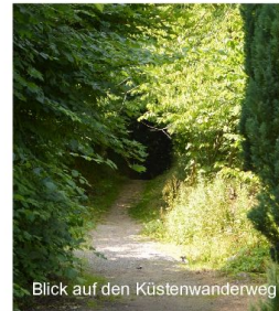
Blick auf den Küstenwanderweg

Wo früher der Strandvogt die Küste bewachte, Landwirtschaft und Fischfang betrieb, finden Sie heute unsere kleine Ferienwohnanlage: die ALTE STRANDVOGTEI oder in dänischer Sprache „ Den Gamle Strandfoged Gård. Die Alte Strandvogtei beherbergt sieben Wohnungen für 1-5 Personen und liegt direkt an der Küste auf einem rund 20.000 qm grossen Areal, inmitten der wildromantischen Natur Nordbornholms, unweit des malerischen Fischerdörfchens Gudhjem und den in Dänemark bekannten, majestätischen Helligdommenklippen.