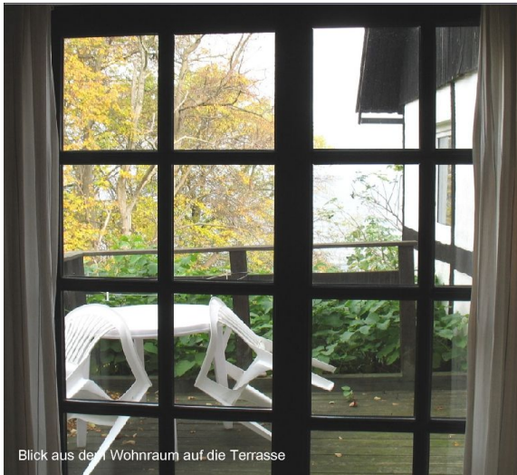
Blick aus dem Wohnraum auf die Terrasse